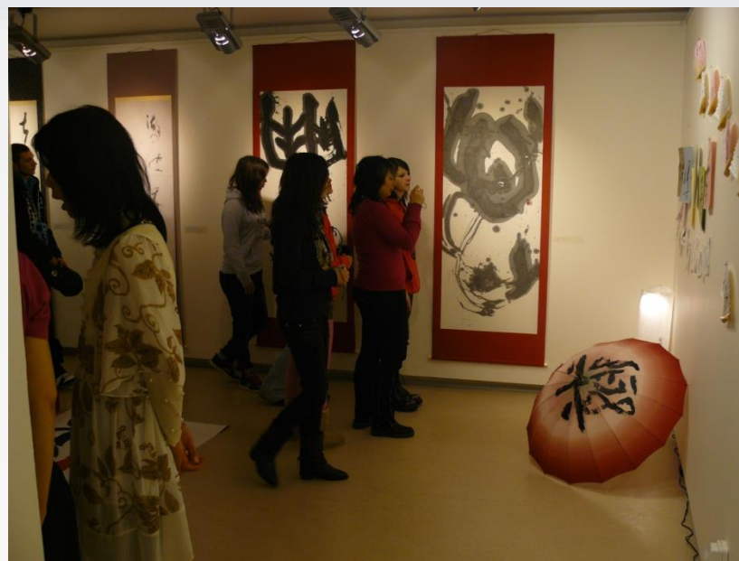
s Česko-japonskou společností