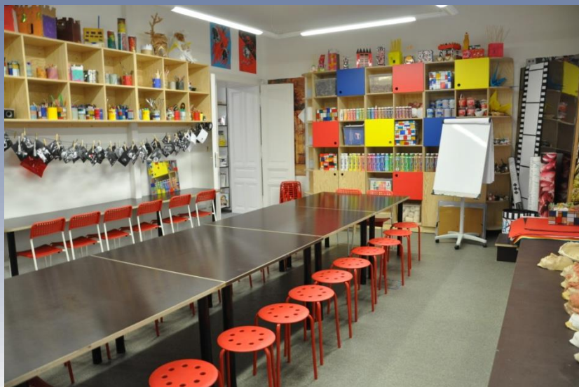
Edukační centrum - ateliér