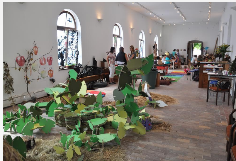
Trojský zámek – eko-ateliér