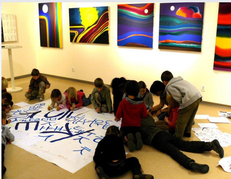
s Česko- korejskou společností