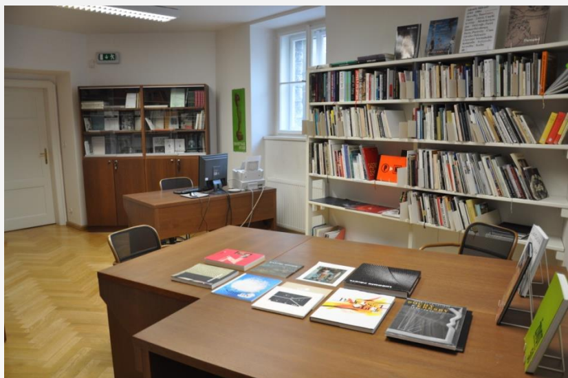
Bílková vila - čítárna a studovna