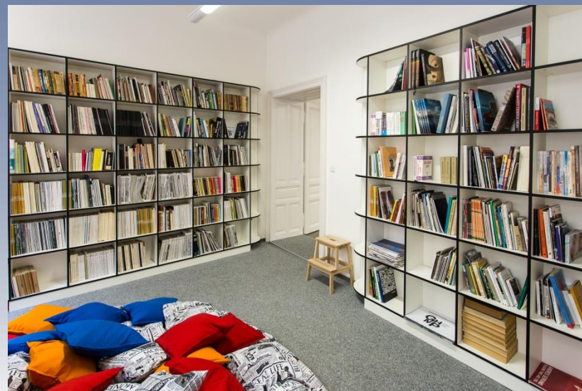
Edukační centrum – knihovna a čítárna